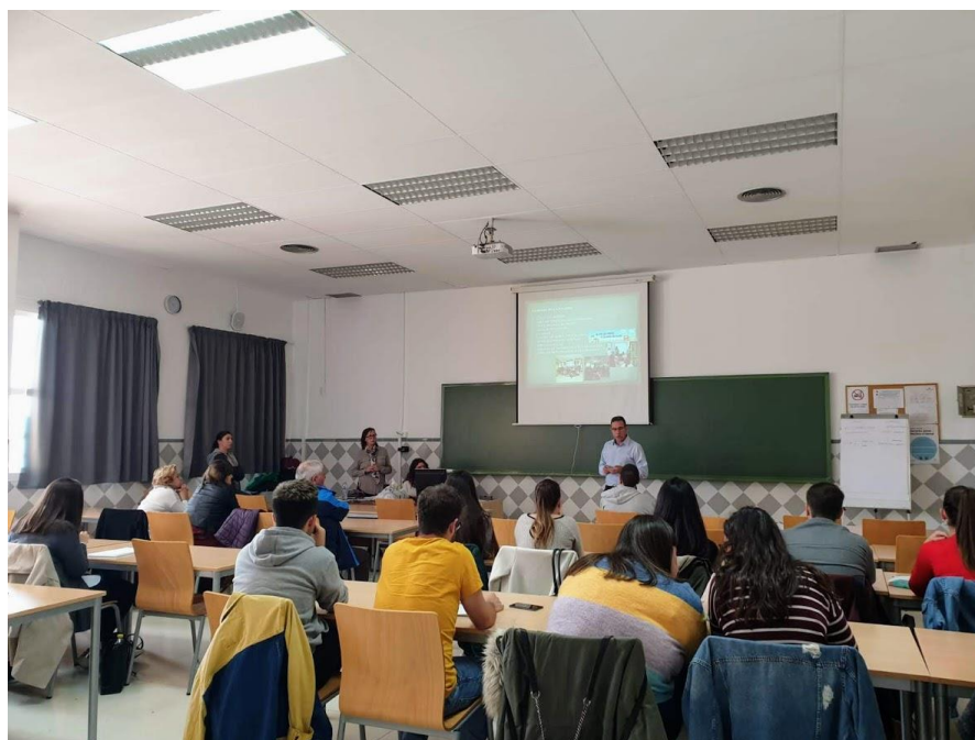
Charla en la Facultad de Derecho (UMA). 25 de abril de 2019